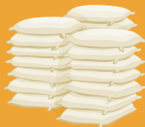
Paaduen ti apitda