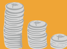
Kissayan ti gastosda iti panagpatanurda iti produkto